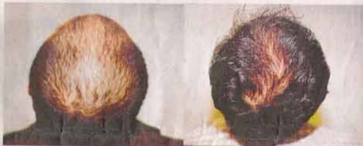
陈爱霖医生指出，年轻人如果在青春期开始脱发，应该及早求医。图为脱发患者治疗前后的区别。